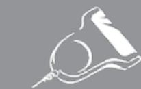
Scanner (alimenté par la balance)